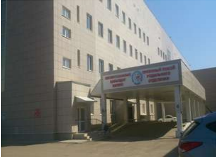
Областной перинатальный центр