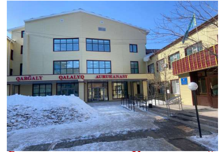
Родильное отделение Каргалинской городской больницы