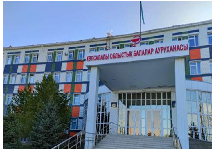
Родильное отделение «АМЦ»