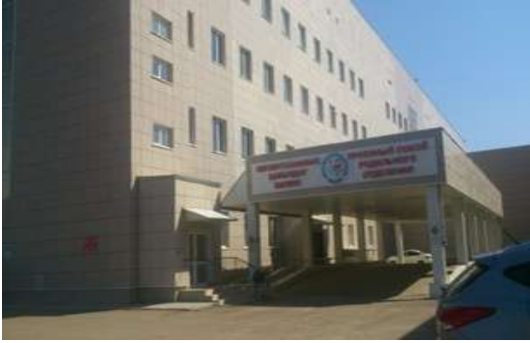
Областық перинаталдық орталығы