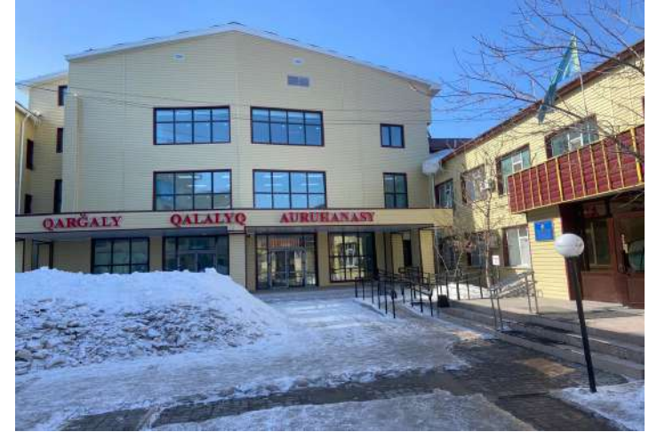
Қарғалы қалалық ауруханасы, босану бөлімшесі