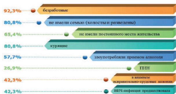
Рисунок 1. Факторы риска по ВИЧ-ассоциированному туберкулезу

Туберкулез выявлен впервые у 7 чел (26,9 %), рецидив у 19 (73,1 %). Легочные формы были выявлены у 17 пациентов (65,4 %), внелегочные формы у 2 (7,7 %) и генерализованный туберкулез диагностирован у 7 (26,9 %). Информация по годам поступления в областной противотуберкулезный диспансер и методам диагностики пациентов с ВИЧ-ассоциированным туберкулезом представлена на таблице № 1.